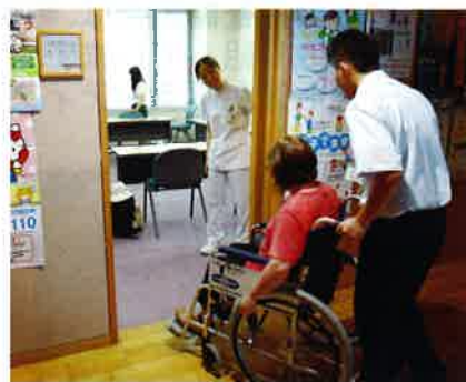
車いすの使い方を学んでいます。